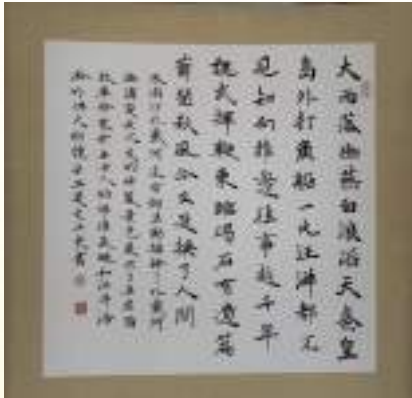
袁亚东《浪淘沙·北戴河》书法类第一名